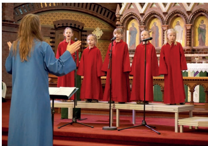
Barnekoret deltok på gudstjeneste 9.2.

og sørger for at stemmene blir godt forberedt. Her er ikke målet å starte øvelsen med å synge høyest mulig.