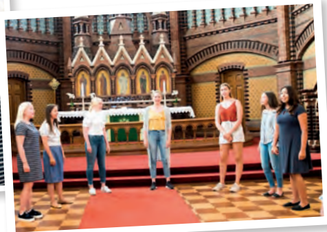
Jentegruppa med vakker sang.