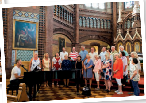
To Spir avsluttet med Elvis.