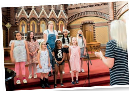
Barnekoret med sangglede.