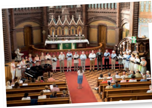
Kantoriet i Skien menighet.