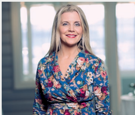
Hilde ønsker oss velkommen til Tre Sopranos Jubileumsjul fredag 21. desember kl. 19.00!

Nå til jul skal Tre Sopranos holde julekonsert i Skien kirke igjen, det er et par år siden sist. I år feirer Tre Sopranos også 10 år som gruppe, og vi markerer dette med å slå litt på stortromma musikalsk. Vi har derfor med oss et stort kor som skal høyne juleopplevelsen for publikum, sammensatt av sangere fra hele Grenland. Mitt personlige ønske er at julens egentlige budskap med feiringen av Jesu fødsel, og vårt håp i troen, kommer frem i min musikk, også når jeg står på scenen og synger med Tre