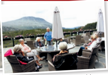
Kaffepause på Industriarbeidermuseet-Vemork.