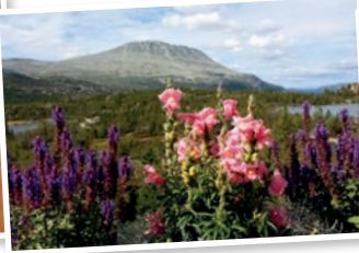
På hotellets terrasse med utsikt mot Gaustatoppen