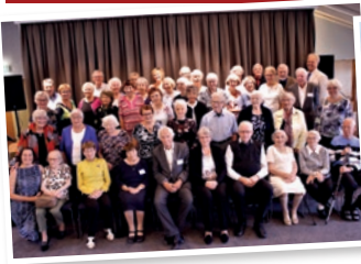
Hele gjengen samlet til festkveld.