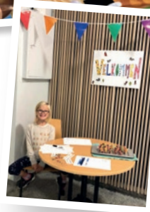
Velkommen til supertirsdag!