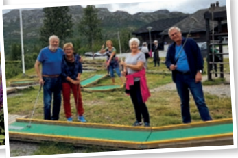
Minigolf skaper engasjement!