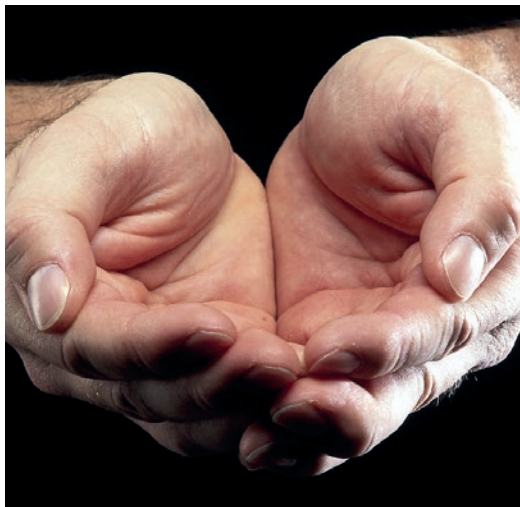
Gi oss i dag vårt daglige brød

nordover, og det er en lukt som sitter i nesa helt til en kommer til Odda hvis en overlever alle de mørklagte tunnelene da.