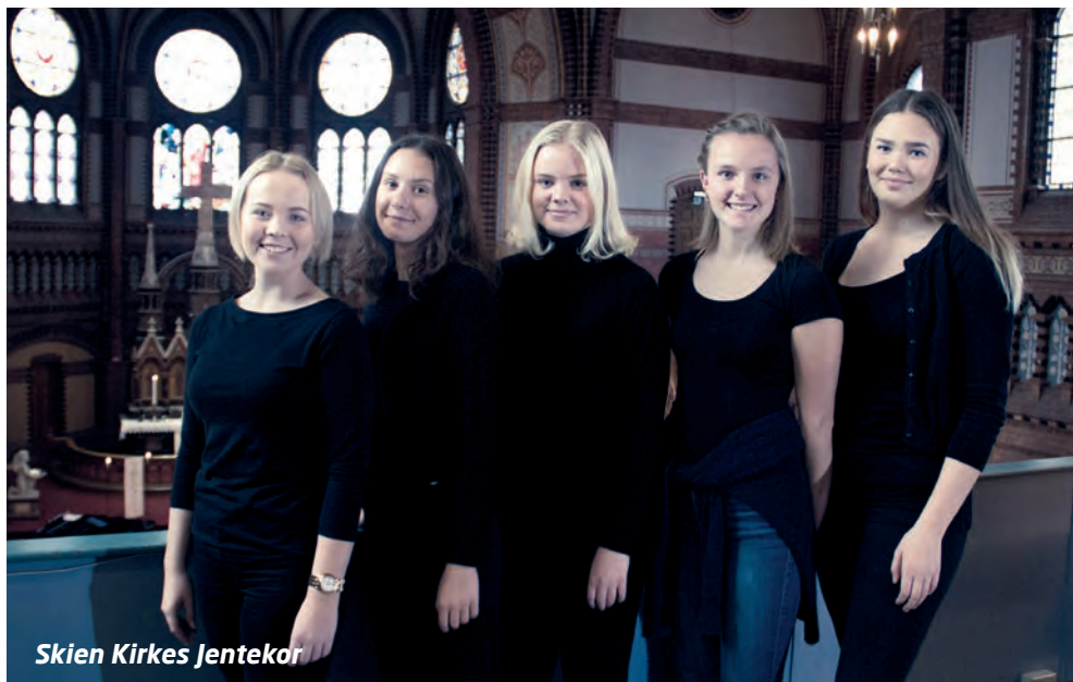
Skien Kirkes Jentekor